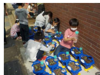
《1年：アサガオの観察》