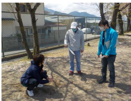
生活科、総合的な学習の時間の教材研究