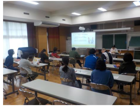
「エピペン」の使い方講習会