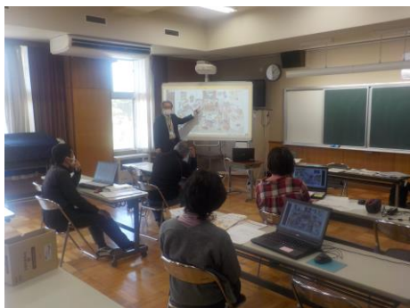
デジタル教科書(英語)の使い方

また、「生命を脅かすアレルギー反応」に関する研修では、アナフィラキシー・ショック時の一次救命手当てとしての「エピペン」の使い方講習も行いました。