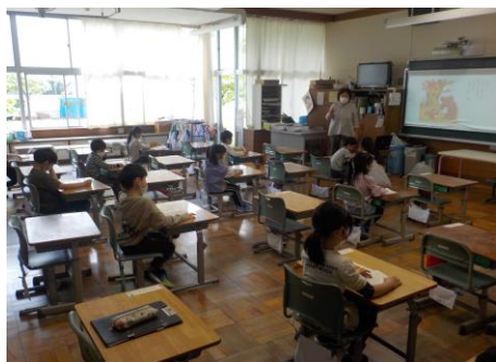
《1年生：教室での学習》

ここまでの長期間、自宅で過ごさなければならぬ事態となり、子どもたちはもちろん、ご家族の皆様には、これまで大変なご協力をいただき、心から感謝申し上げます。ありがとうございました。今後も、決して油断することなく、「3つの密」を徹底的に避ける、「マスクの着用」「咳エチケット」「十分な換気」「手洗いなどの手指衛生」「ソーシャルディスタンス」など、基本的な感染防止対策を継続する「新しい生活様式」を導入して学校生活を進めていきますので、ご理解ご協力をよろしくお願いいたします。