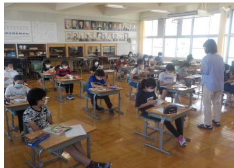
《6年生：音楽室での授業》

右の写真は、6年生の音楽の授業です。3密を避けることができるよう、学習内容を工夫しながら授業を進めています。