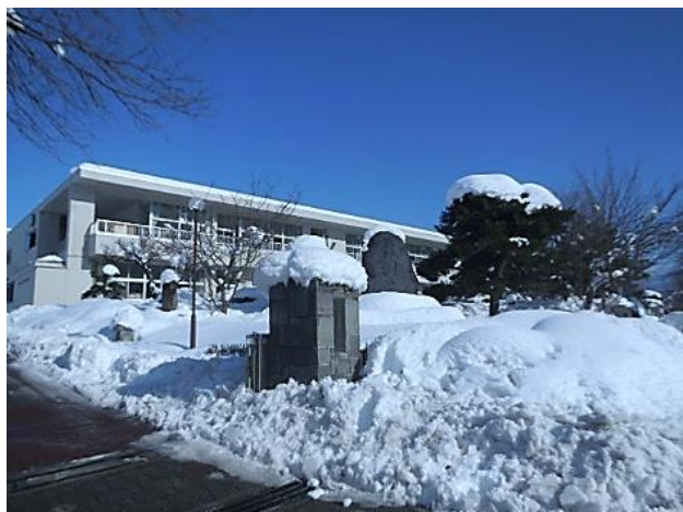
大雪に覆われた日滝小学校の校門

1月16日（月）に降り始めた雪は、それまでの雪とは比べものにならないほどの積雪をもたらしました。朝学校に来てみると、通学路はもちろん、昇降口までの道のりも子どもたちの膝下くらいまでであるような雪で覆われていました。子どもたちの登校が10時30分になったので、早速職員と保護者の皆さんによる雪かきが始まりました。各区の区長さんにも連絡をし、子どもたちの通学路確保にご協力いただくようお願いをさせていただきました。